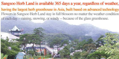
Sangsoo Herb Land is available 365 days a year, regardless of weather, having the largest herb greenhouse in Asia, built based on advanced technology. Flowers in Sangsoo Herb Land stay in full blossom no matter the weather condition of each day – raining, snowing, or windy – because of the glass greenhouse.