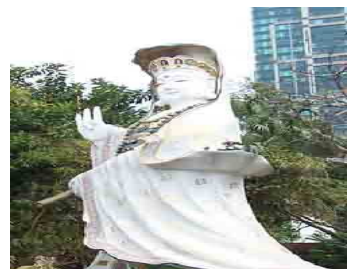
รายละเอียดการเดินทาง

วันแรก สุวรรณภูมิ - ฮ่องกง - เซ็นเจิ้น (อาหารค่ำ)